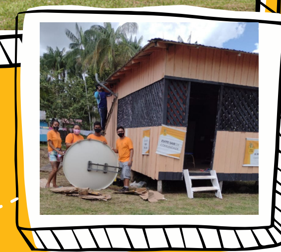
COMUNIDADE SANTO ISIDORO