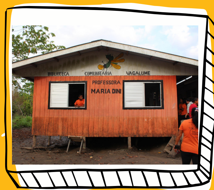
COMUNIDADE NOSSA SENHORA DO PERPÉTUO SOCORRO