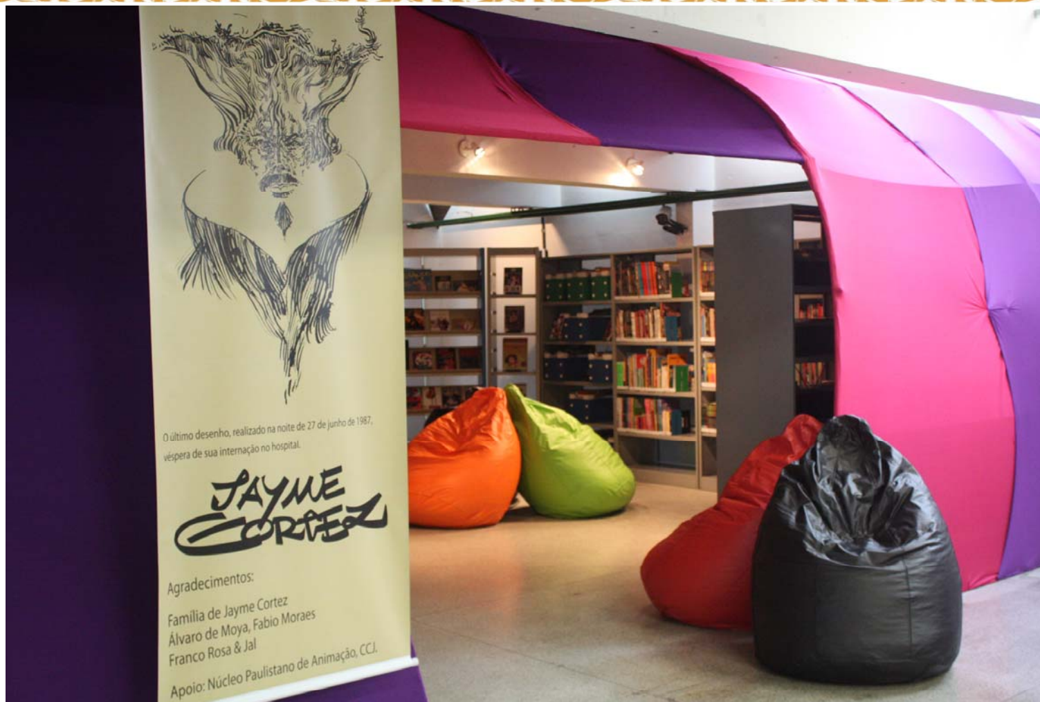
HQTeca da Biblioteca Jayme Cortez – Inaugurada em 20 de março de 2010